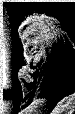
Margherita Hack La celebre astrofisica non nasconde di credere nell'energia nucleare e nelle sue potenzialità, la sua fiducia è nella ricerca