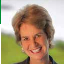
Kathleen Kennedy Townsend Vice President of The Future of Science

Kathleen Kennedy Townsend is Vice President of The Future of Science. Ms. Townsend has a long history of accomplishment in the public arena, and for the last decade has in the private sector. She is a Managing Director at the Rock Creek Group, an investment management company. Ms. Townsend founded the Center for Retirement Initiatives at the McCourt School of Public Policy at Georgetown University, where she is a Research Professor. As the State of Maryland's first woman Lieutenant Governor, Ms. Townsend was in charge of a multimillion-dollar budget and had oversight of major cabinet departments, including Economic Development and Transportation, State Police, Public Safety and Correction and Juvenile Justice.